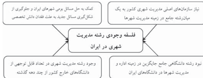
شکل شماره ۲. چهارچوب تحلیلی فلسفه وجودی رشته مدیریت شهری در ایران